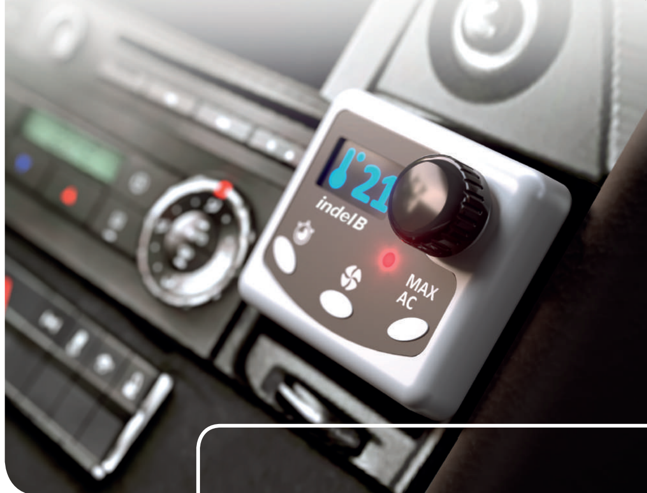
CONTROL PANEL DISPLAY DI CONTROLLO

La soluzione perfetta per garantire un clima ideale durante le soste, con una maggiore aerodinamicità durante i tragitti. Non impegna l'oblò della cabina.