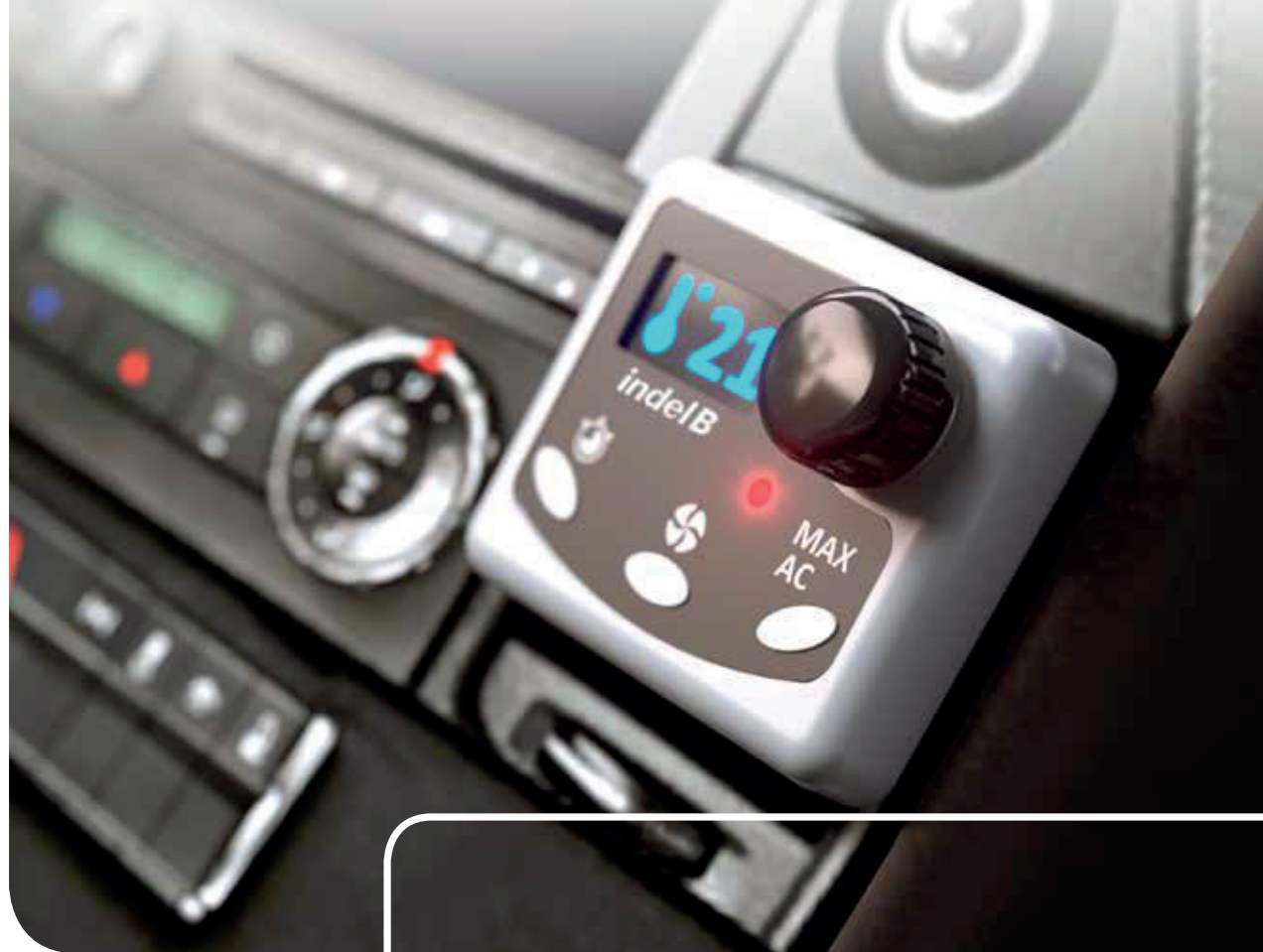
CONTROL PANEL DISPLAY DI CONTROLLO

Un sistema rivoluzionario che non intacca l'estetica del mezzo perchè ne utilizza gli elementi originali come le bocchette ed il sistema di ricircolo. Più silenzioso grazie al posizionamento del compressore sullo chassis del camion. Con doppia impostazione di potenza: 1000 watt per una durata di almeno 6 ore o 2800 watt in modalità turbo con autonomia minima di 2 ore (per i caldi più estremi). La soluzione perfetta per garantire un clima ideale durante le soste, con una maggiore aerodinamicità durante i tragitti. Non impegna l'oblò della cabina.